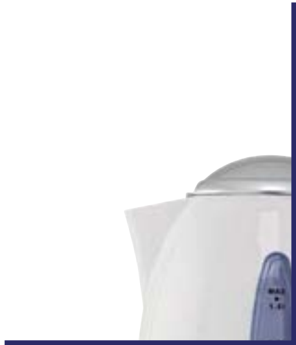
Kettles & Coffee