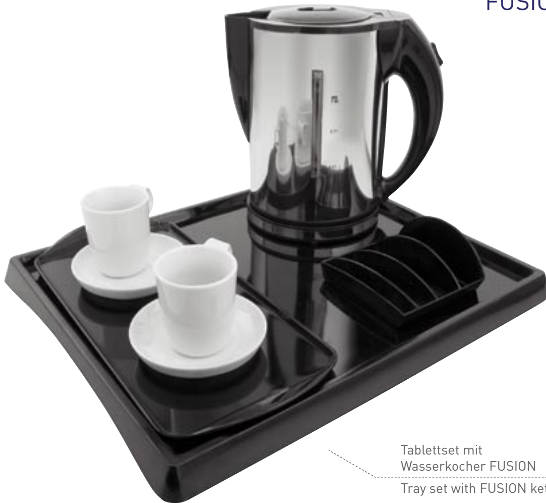
Tablettsset mit Wasserkocher FUSION Tray set with FUSION kettle

Edelstahlummantelung glänzend oder gebürstet