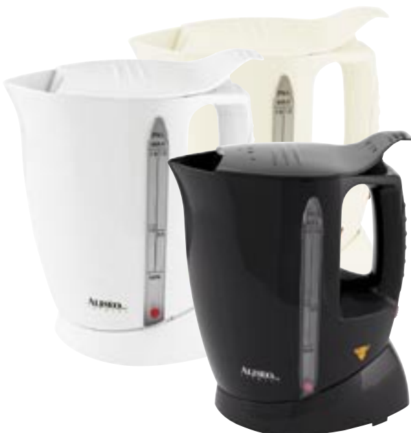
Tray set with EXXEL kettle