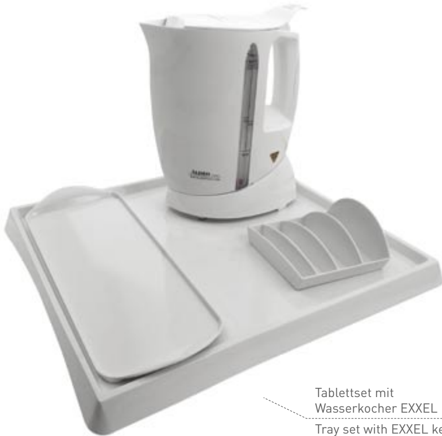
Tablettsset mit Wasserkocher EXXEL